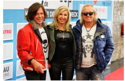
Sparhandy-Cup 2014 „Kicken für den guten Zweck“