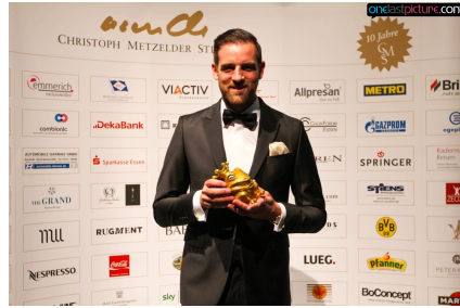
Das große Jubiläum: 10 Jahre Christoph Metzelder Stiftung